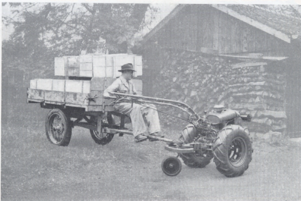
Motoculteur 60 A avec bras de traction élastique dans un virage court.

Landwirtschaftsmaschine 60 A mit elastischem Zugarm in einer kurzen Wendung.