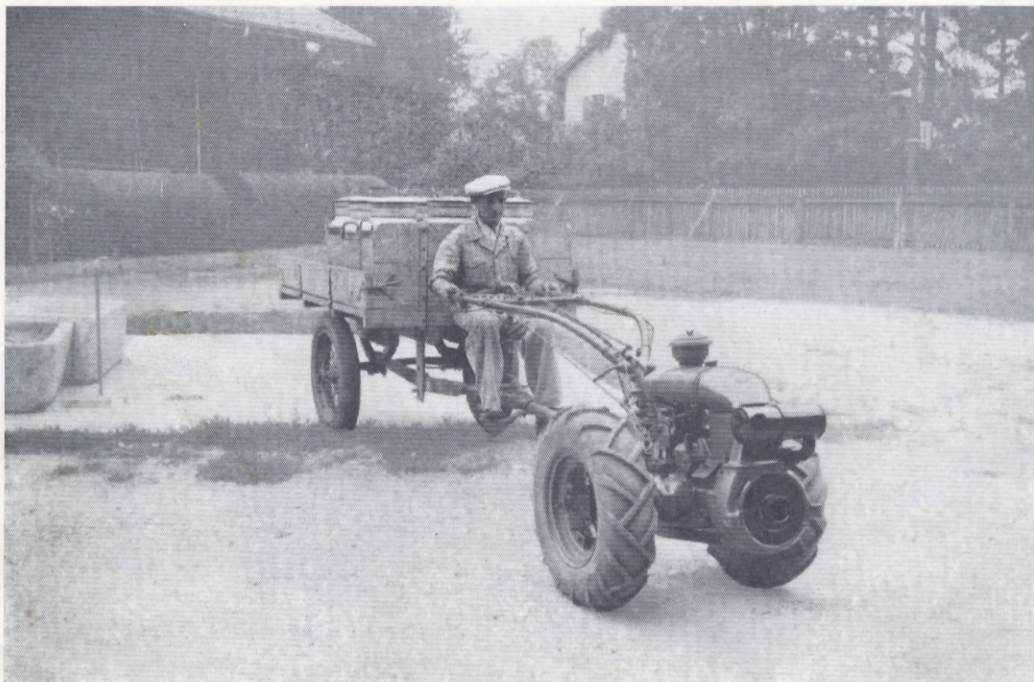
Motoculteur 60 A avec remorque vu de devant. Landwirtschaftsmaschine 60 A mit Anhänger von vorne gesehen.