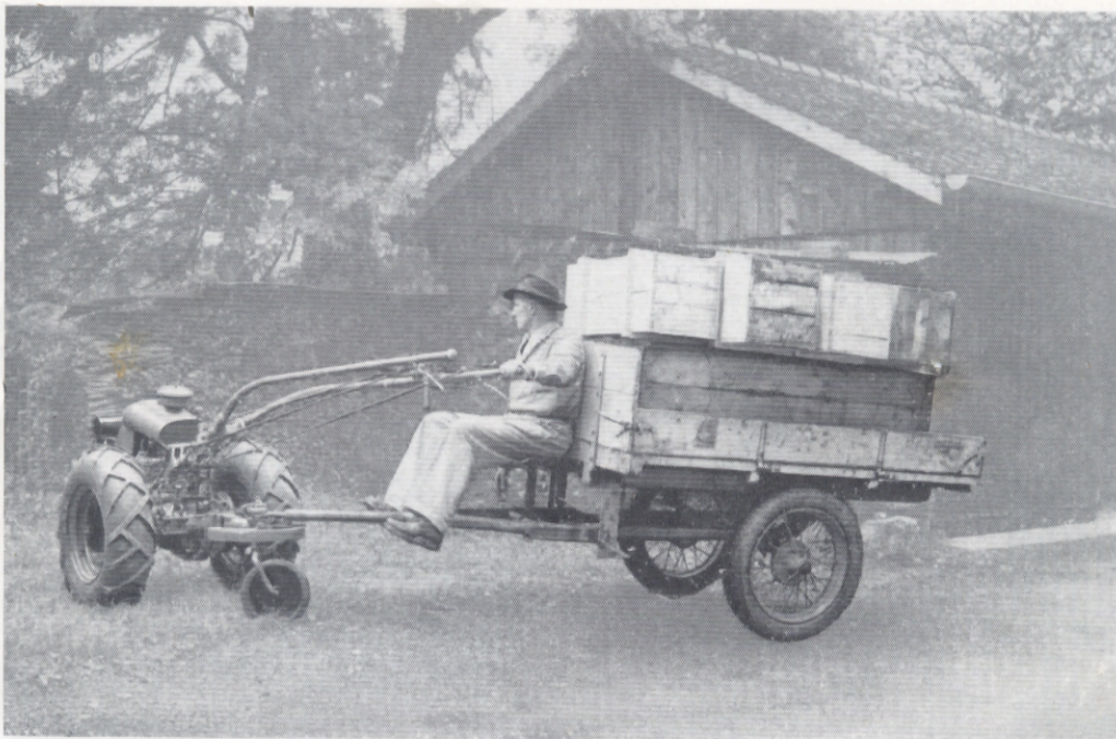
Motoculteur 60 A avec bras de traction élastique dans un virage court.

Landwirtschaftsmaschine 60 A mit elastischem Zugarm in einer kurzen Wendung.