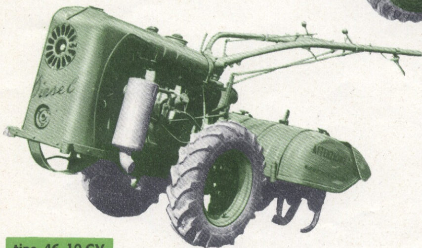
tipo 46 10 CV